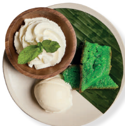
902. Banh Bo Nuong 热香兰蛋糕和冰淇淋 7,00 Pandan Bread Cake Pandan cake met een bolletje ijs