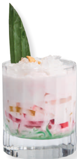
901. Che Suong Sa Hat Luu 七色甜品(冷) 6,00 7 Colour Coconutmilk Drinkdessert 7 kleuren kokosmelk drankdessert